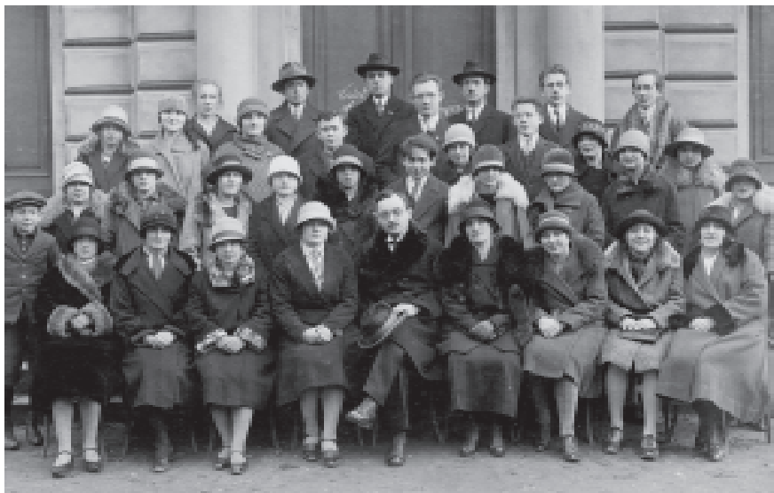
Rok 1925, sdružení mládeže farního sboru ČCE Mělník, jehož převážná část byli pěvci pěveckého sboru mládeže.