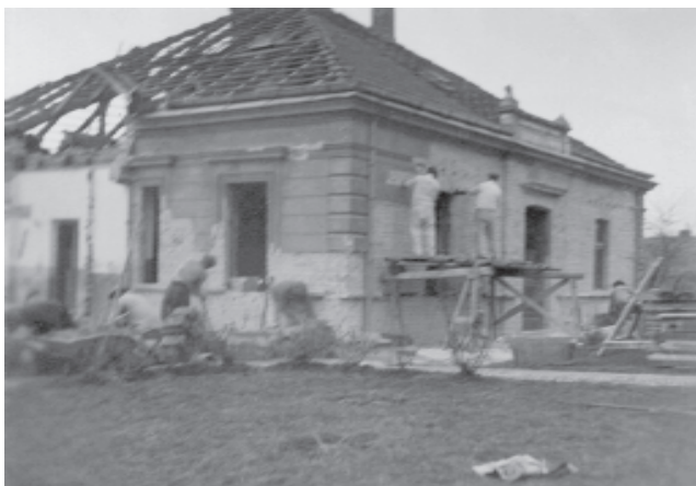
První fara, postavená roku 1903, rok 1937