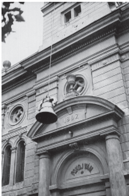
Nové zvony, 28. 10. 1935