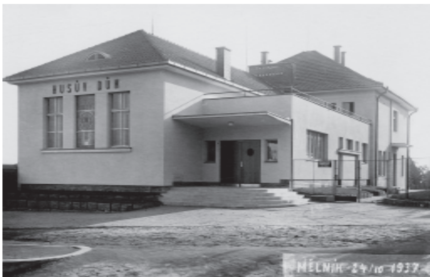
Husův dům v roce 1937

Ve dnech 14.-18. ledna 1942 se v Mělníku konala hojně navštívená zimní škola mládeže.