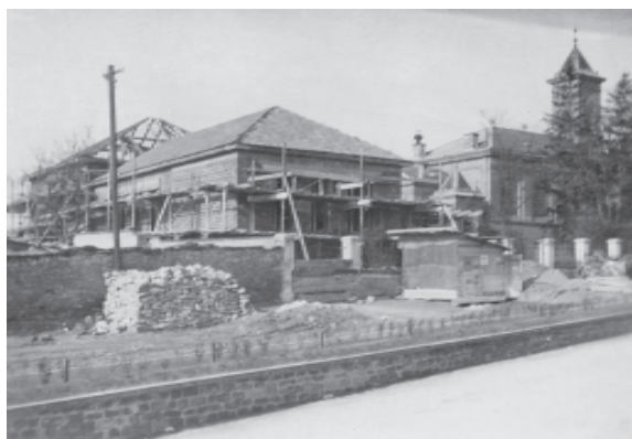
Stavba 3. 5. 1937

níku, a přeje tamnímu sboru, aby z něho vycházely opravdové duchovní podněty nejen do sboru, ale i do veškeré veřejnosti.“