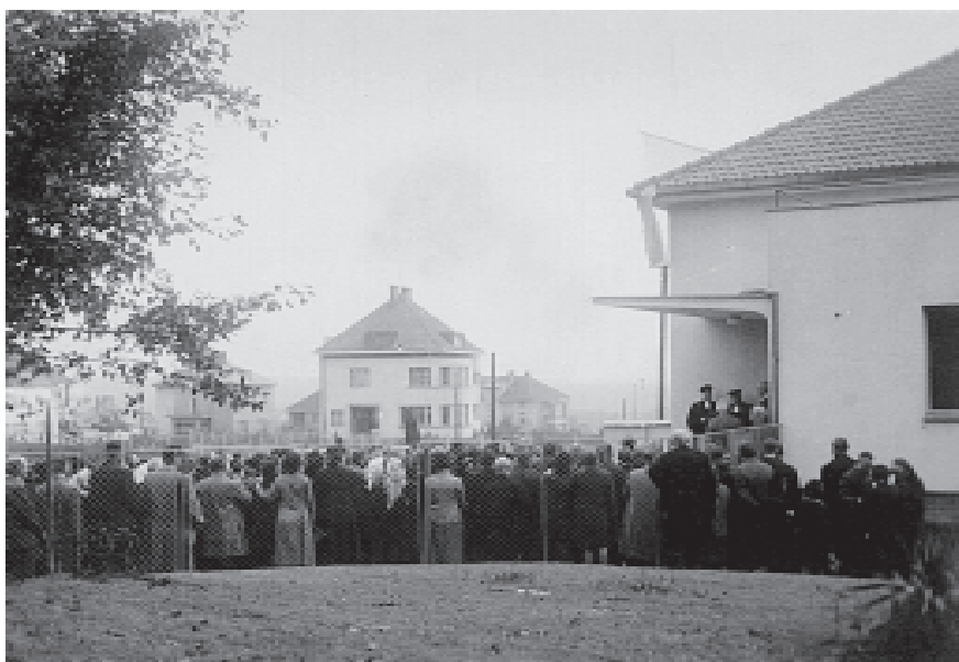
Otevření Husova domu 24. 10. 1937