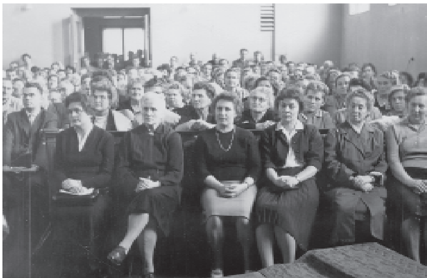
Kolín, 20. 10. 1963, evangelizační shromáždění