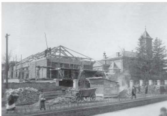
Stavba Husova domu, 22. 4. 1937